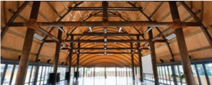
Fale Pasifika, lunivesiti e Okaladi

Ni tara e dua na vale, na ka e bibi taudua sa i koya na kena vakaukauwatak vinaka na kena yavu.