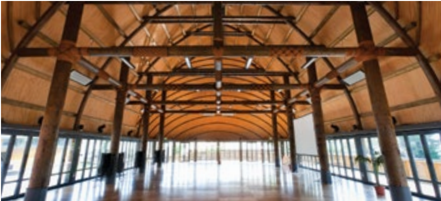
Fale Pasifika, 'Univēsitī 'o 'Aokalani

'I he taimi 'okú ke langa ai ha fale, 'oku mahu'inga 'aupito ke mālohi 'a e fakava'e.